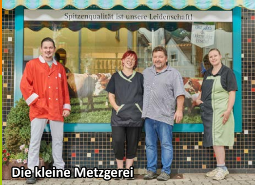
Die kleine Metzgerei