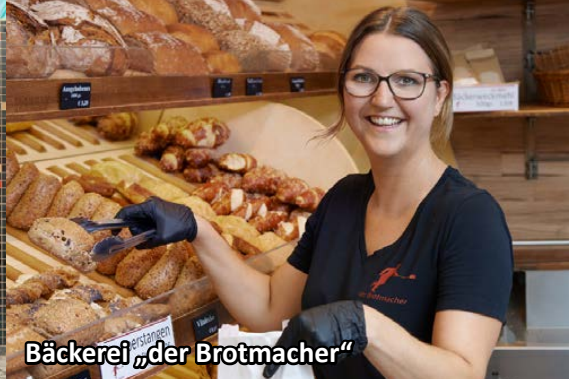
Bäckerei „der Brotmacher“